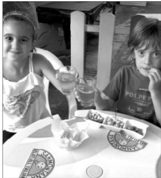
I due cuginetti protagonisti dell'iniziativa